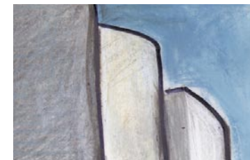
Pompenburg Compositie van verschillende grote vrijstaande woongebouwen,