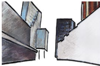
Korte Hoogstraat Combinatie van het oudste gebouw, wederopbouw en ver- dichting van de 90er jaren: