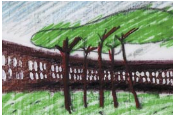
De Savornin Lohmanlaan Planmatig stedelijk ensemble.