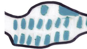
Eendrachtsplein Verzameling van verschillende losse gebouwen.

Ten behoeve van een zo breed mogelijke verkenning van het terrein hebben we elf stedenbouwkundige ensembles geselecteerd, die grofweg een doorsnede zijn van de bebouwing uit verschillende episodes verspreid over de Rotterdamse stad. Van deze ensembles zijn de kleurbeelden nauwkeurig geanalyseerd. In Rotterdam zijn dat bijna overal beelden die niet door één kleur worden gedomineerd. Vandaar dat we spreken over kleurbeelden, dat wil zeggen over de samenstelling van verschillende individuele kleuren en texturen, die een geheel vormen. We kijken wat deze beelden in ruimtelijk opzicht doen met de gebouwen onderling en de aangrenzende buitenruimtes. We isoleren de afzonderlijke gebouwen niet, noch beperken we ons tot afgebakende eenheden als straten, buurten of wijken. De geschikte ruimtelijke eenheid voor de