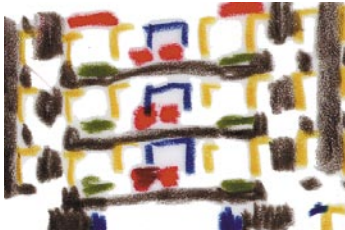
Willem Smalthof Grootschalige stadsvernieuwing 70-er jaren nieuwbouw