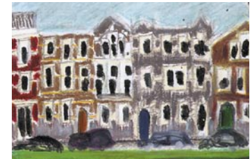
Voorschoterlaan Niet planmatig Beschermd stadsgezicht