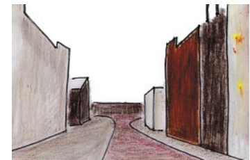
Lisstraat Vervangende nieuwbouw in 19e-eeuwse wijk