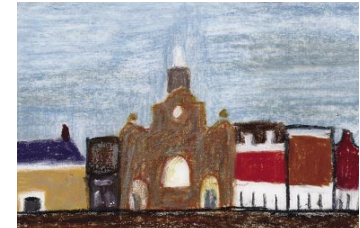
Voorhaven Historische stadskern Beschermd stadsgezicht